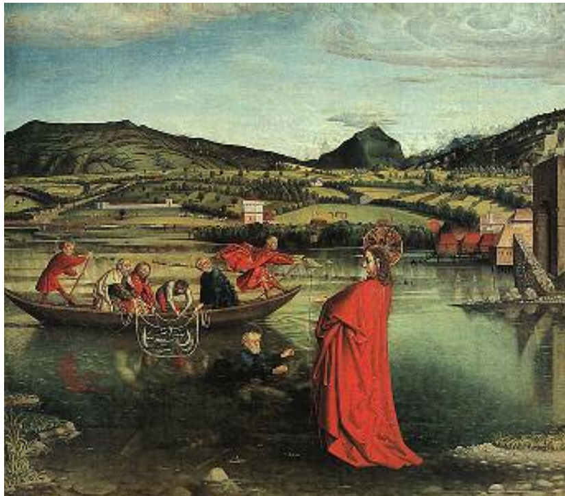
كوئراد فيتز Conrad Witz